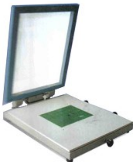
Carte tenue sur sur plateau forex