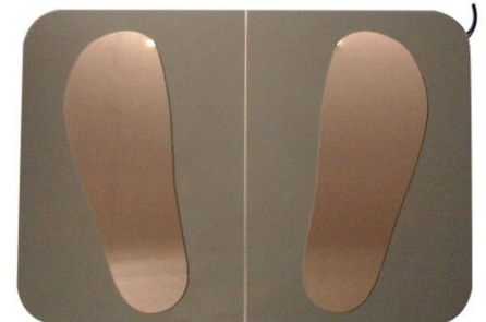
Bild: Schuhwerkelektrode für getrennte Schuhmessung (350 x 500 x 8 mm)