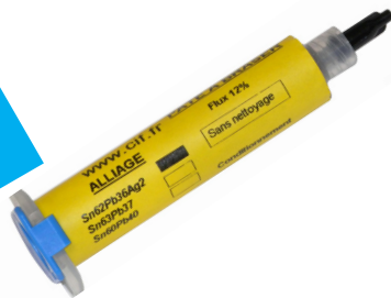
LA CREME À BRASER POUR CMS ALLIAGE SANS PLOMB

Alliage Sn96.5Ag3Cu0.5 (96.5% d'étain, 3% d'argent et 0.5 de cuivre) Température de fusion 217°C Conditionnement en seringue de 10cc avec ou sans poussoir, ou en cartouche de 170cc (0.5kg) Flux sans nettoyage à 12% Classe 5