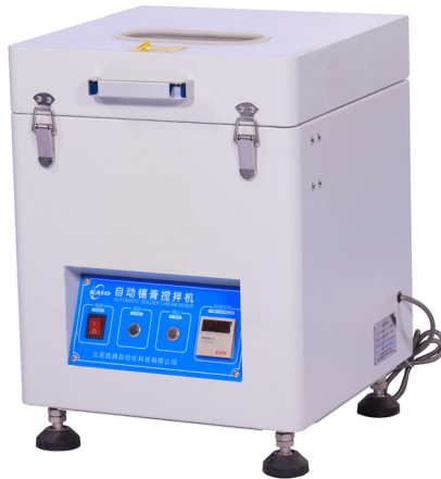
Mixeur automatique de pâte à braser double rotation.